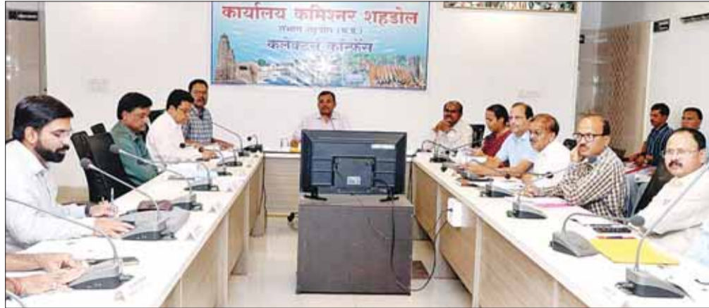
अनुपलब्धता के कारण लंबे समय तक लंबित रह जाते हैं इसके लिए आवश्यक है कि संबंधित निर्माण विभाग डीपीआर तैयार करने के बाद ही भूमि आबंटन संबंधी आवेदन राजस्व एवं वन विभाग के पोर्टल में ऑनलाईन करें।

पोर्टल में ऑनलाईन करें आवेदन आयुक्त श्री जामोद ने कहा कि जनता से जुड़े कार्य भूमि की